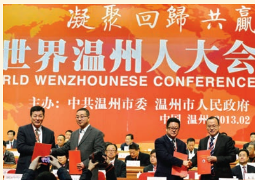
2月15日，2013世界温州人大会在市人民大会堂举行。