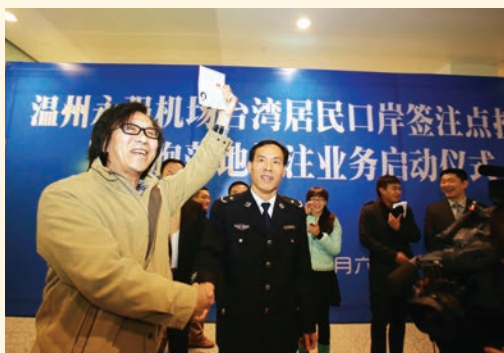
2月6日，温州永强机场台湾居民口岸签注点正式启用。