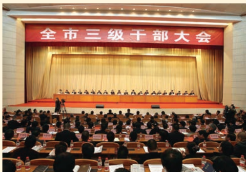
2月26日，市委市政府召开全市三级干部大会。