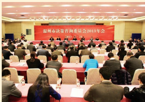
2月28日，我市决策咨询委员会2013年会在市人民大会堂举行。