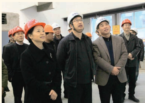
2月17日，市长陈金彪督查温州日报报业集团新印务中心等项目建设。