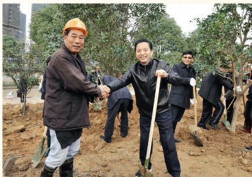
2月16日，省委常委、市委书记陈德荣参加全市党政军领导义务植树活动。