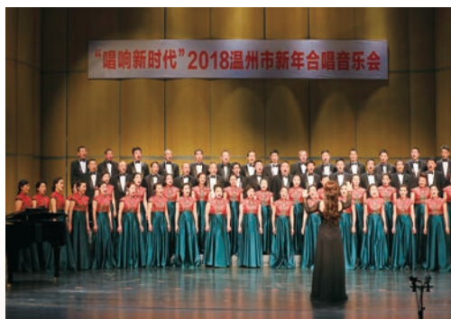
1月7日，“唱响新时代”2018温州市新年合唱音乐会举行。