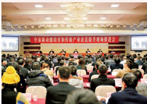
1月4日，全市新动能培育和传统产业改造提升现场推进会举行。