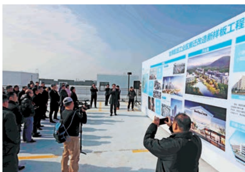
1月9日，2017年度温州“比学赶超”社会各界“走现场、看实效”实地观摩活动举行。图为观摩团观摩龙湾旧工业区搬迁改造新样板工程。