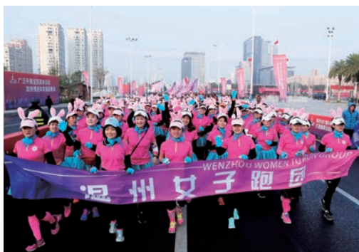
1月1日，一年一度的温州市元旦升国旗仪式暨万人健身跑活动举行。