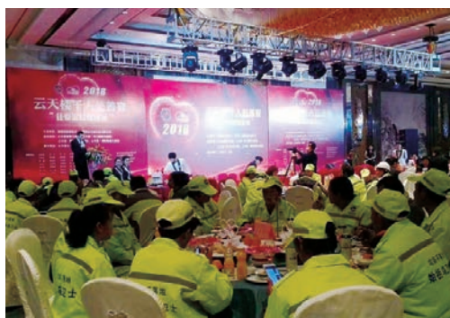
1月19日，“爱心温州·情暖万家”第16届新春慈善大宴在六地同时开席。