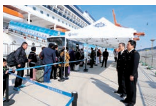
海关关员对状元香国际邮轮港首条邮轮航线首航开展监管作业

装箱班轮航线,首航当日共监管出境集装箱80标箱。通过一系列举措,我市口岸辐射带动能力进一步增强。