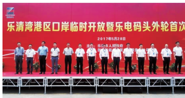
乐清湾港区口岸临时开放暨乐电码头外轮首次靠泊仪式举行

装箱班轮航线,首航当日共监管出境集装箱80标箱。通过一系列举措,我市口岸辐射带动能力进一步增强。