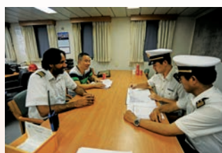
海关关员开展船勤作业