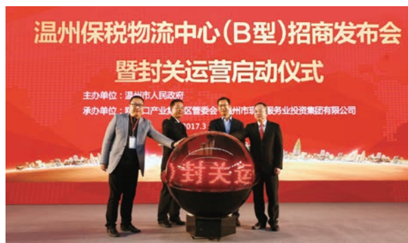
温州保税物流中心(B型)封关运营启动仪式举行