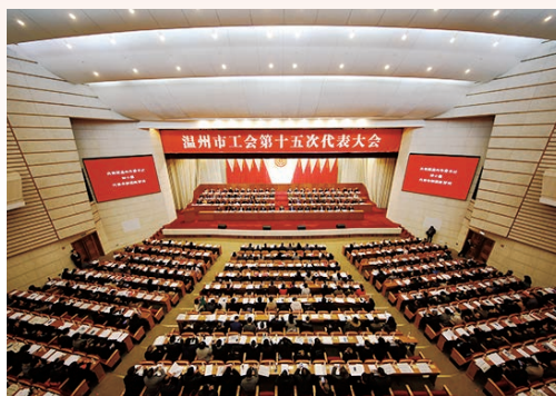
1月5日，温州市工会第十五次代表大会开幕。