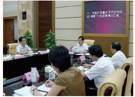
徐立毅代市长主持召开市长办公会议督查“清零”行动

根据部署,“清零”行动将延续至今年年底。徐立毅代市长在对“清零”行动进行专项督查时强调,要决心下到底,思想再重视,坚持既定目标不动摇,下更大决心、更大力气,坚决啃下“硬骨头”,确保按时完成“清零”任务,为重点项目建设保驾护航,为推进温州转型发展、赶超发展凝聚正能量。