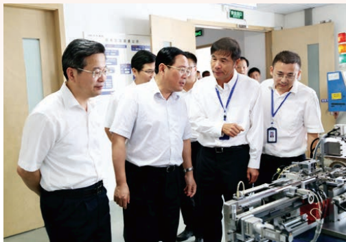
9月8日至10日，省委副书记、省长李强在温州调研经济工作。图为李强省长赴我市企业考察。