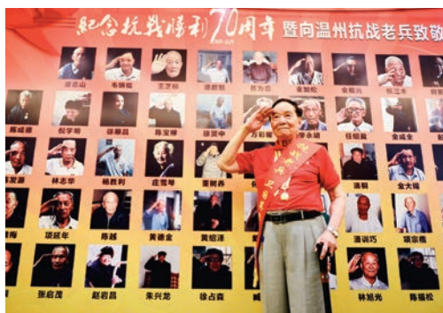
9月2日，纪念抗日战争胜利70周年暨向温州抗战老兵致敬典礼在乐清举行。