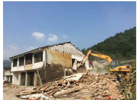
瑞安市陶山镇桐溪村“清零”拆迁现场