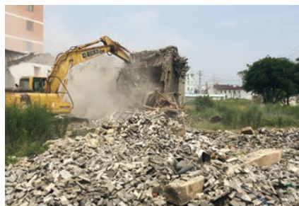
龙湾区海滨街道教新村“清零”拆迁现场