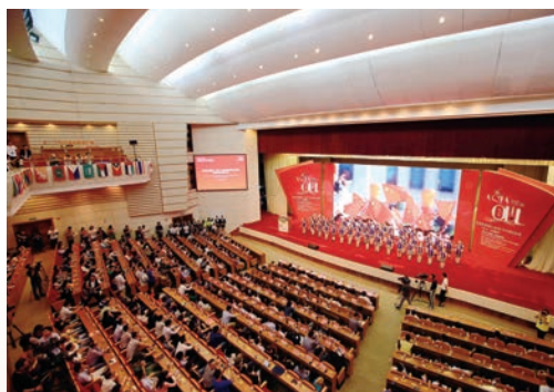
9月23日，首届亚洲国际（温州）青年微电影展开幕式暨微电影高峰论坛在市人民大会堂举行。