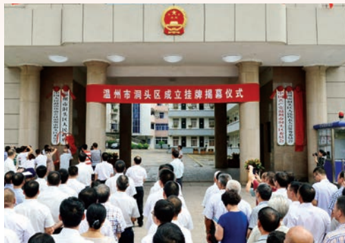
9月2日，温州市洞头区成立挂牌揭幕仪式举行。