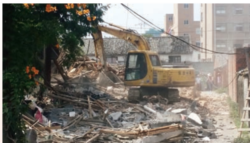
苍南县灵溪镇塘下村“清零”拆迁现场