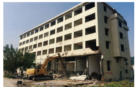
瓯海区潘桥街道仙门村“清零”拆迁现场