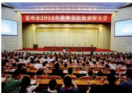
9月10日，市委市政府召开温州市2015年教师节庆祝表彰大会。