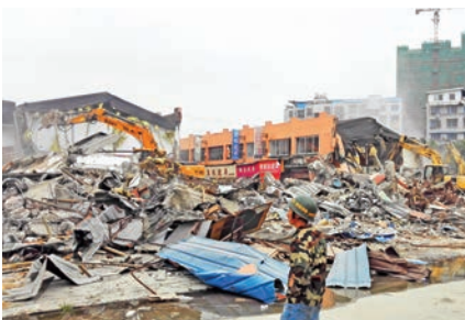
鹿城区浙南鞋料市场“清零”拆迁现场