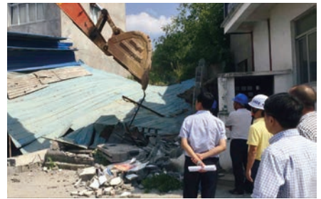
乐清市柳市镇大茅岭村“清零”拆迁现场