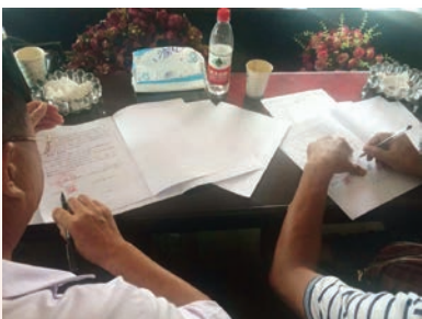
洞头区大门镇东屿村整村搬迁协议签订