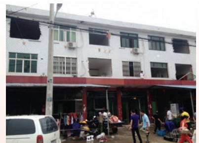
平阳县万全镇东湾村“清零”拆迁启动