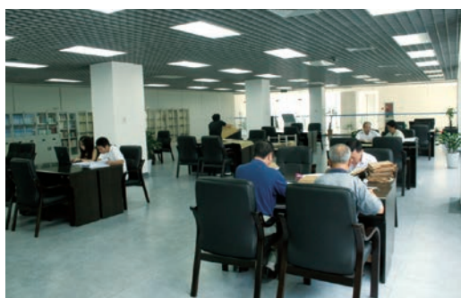
群众在查阅大厅查档