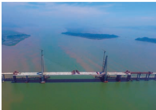
6月30日，乐清湾大桥主跨顺利合龙，大桥右幅单幅贯通。