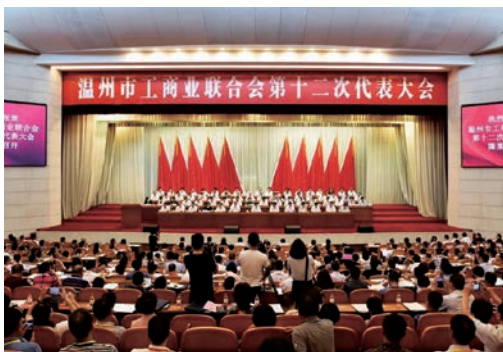
6月23日—24日，温州市工商联第十二次代表大会在市人民大会堂召开。