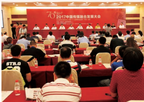
6月22日，2017中国传媒融合发展大会在温州开幕。