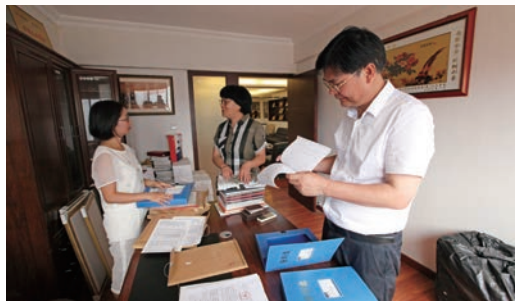
市档案局在福建温州商会开展建档指导

整合资源服务社会。 充分依托档案信息资源共享平台,整合更多档案资源,2017年民生档案计划增加到600万条,推进县级档案馆与各乡镇(街道)、村(居)联接成网,加快完善以基层为重点的档案基本公共服务网络,为人民群众提供更加优质便捷高效的档案公共服务。