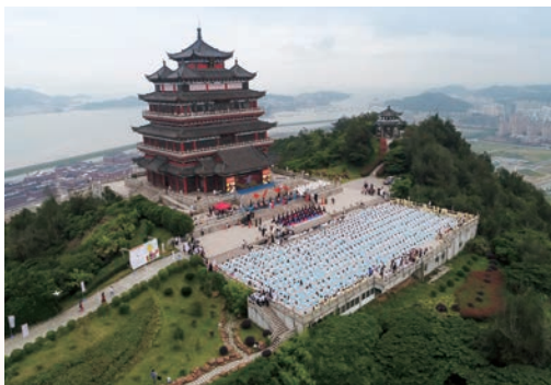
6月18日，2017国际瑜伽日·中国温州（洞头）千人国际瑜伽盛会暨功夫瑜伽活动在洞头区举行。