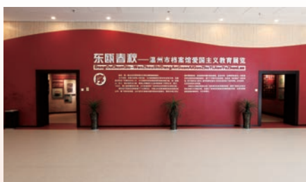
东瓯春秋——温州市档案馆爱国主义教育展览