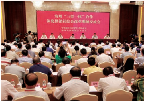
6月22日，全国发展“三位一体”合作深化供销社综合改革现场交流会在瑞安召开。