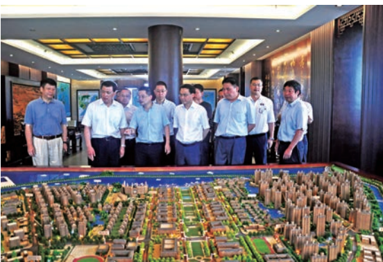
2016年7月7日，袁家军常务副省长视察洞头城市规划建设情况