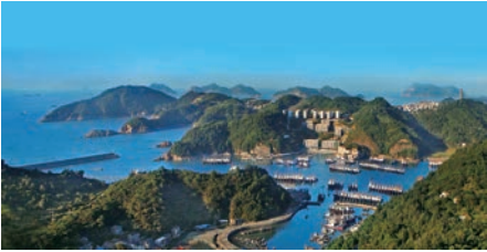
洞头蓝色港湾-东沙湾