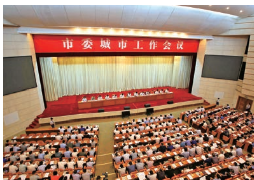
7月15日，市委召开城市工作会议。