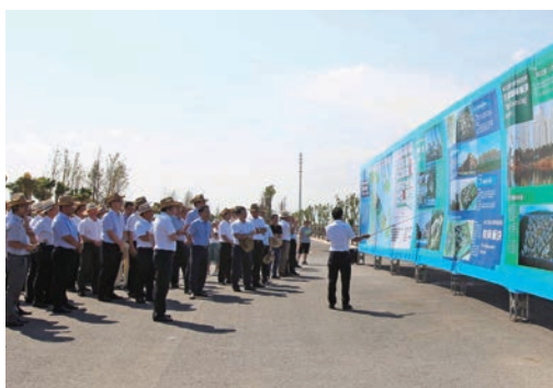
7月13-14日，2016温州第二批“比亮点学先进树标杆”现场观摩活动举行。图为观摩瓯江口重大功能性配套项目。