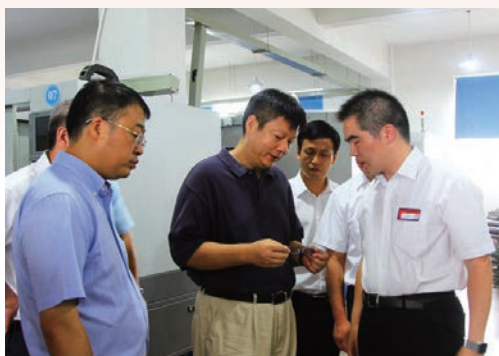
7月18日，市长张耕率队调研传统特色产业。