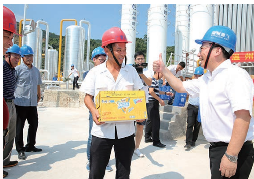
7月26日，市总工会开展“夏送清凉、关爱职工”高温慰问活动。