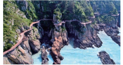
东海第一临海悬崖栈道