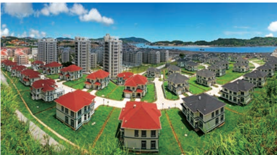
2016年4月15日，洞头区被评为2015年“基本无违建县（市、区）”

2015年7月23日，洞头撤县设区获国务院批复，成为温州新的市辖区。站在历史的新起点，洞头立足海洋、生态资源优势，围绕“加快同城发展，建设海上花园”发展战略，加快推动产业形态向海洋经济转型，城市建设向同城发展迈进，社会发展向同城同享转变，努力打造温州城市东拓主平台、海洋产业集聚区、海岛旅游度假区、生态文明示范区。