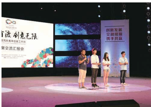
7月14日，“筑梦温州”第二届海峡青年创新创业季启动。