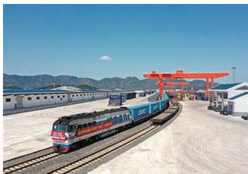
3月19日，“永康-温州-东南亚”快速航线开通，这标志温州港首次实现海铁联运直航出海，为浙西地区外贸客户提供了更高效的出海通道