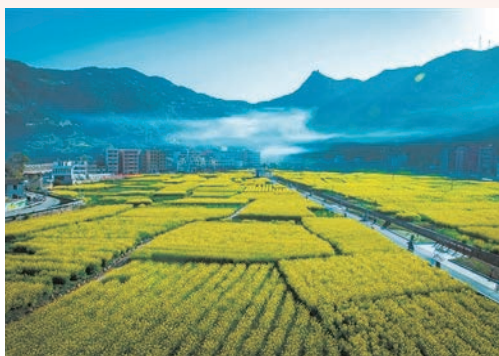
3月，温州各地油菜花田成为打卡新宠，各地发展起集赏花旅游、休闲娱乐、增收致富为一体的“花经济”，图为洞头大门岛油菜花