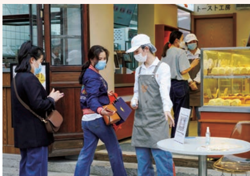
3月，“温州防疫码-场所码”上线，为精准防疫提供重要支撑，图为市区公园路，顾客扫“温州防疫码-场所码”后才能进入店内选购商品