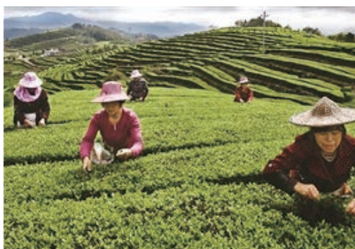
3月，我市早茶集中上市，图为泰顺县仕阳镇万亩茶园春茶采摘忙