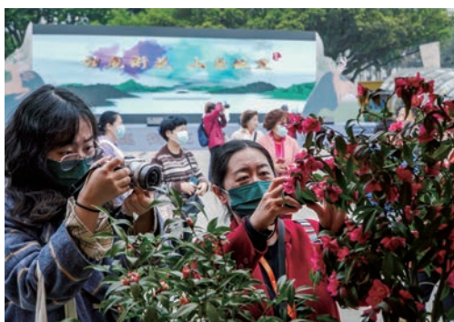
3月5日，第十三届中国茶花博览会在温州九山公园正式拉开帷幕