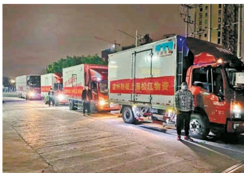
3月30日，我市紧急调配的45吨生活物资顺利抵达上海松江区，助力当地战“疫”