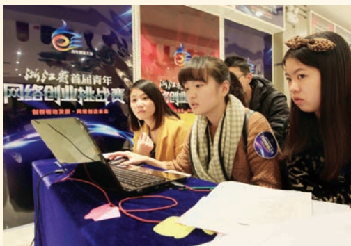
12月6日,浙江省首届青年网络创业挑战赛在我市开幕。