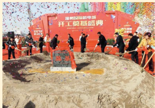
12月28日，省411重点工程——温州国际机电城项目开工奠基。