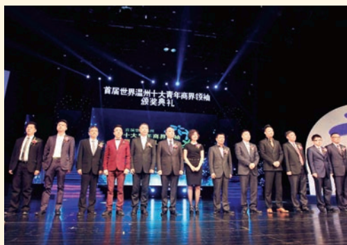
12月18日,首届世界温州十大青年商界领袖颁奖典礼在市大剧院举行。