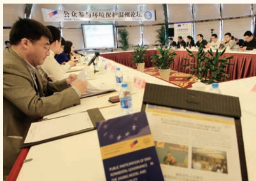
12月12日,中欧环境治理项目浙江地方伙伴项目公众参与论坛在我市举行。