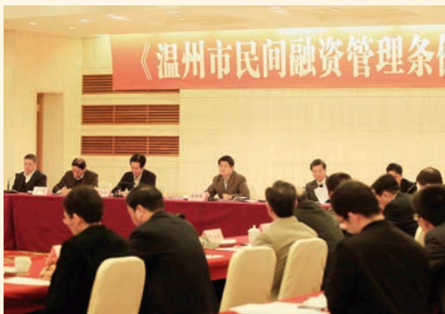
12月5日，《温州市民间融资管理条例》实施工作座谈会召开。