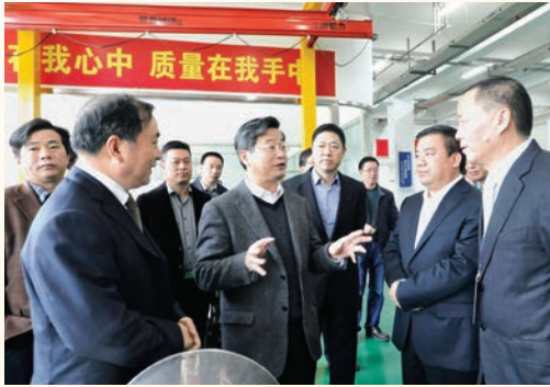
12月4日，市委书记陈一新赴苍南督导实体经济发展。