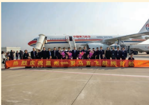
12月24日，温州——罗马直飞航线成功首航。