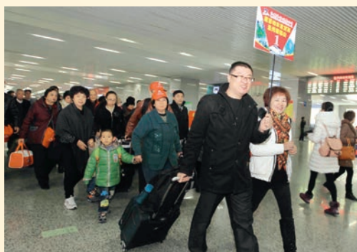
12月28日,温州至深圳实现动车直达。图为深厦动车旅游首发团到达我市。