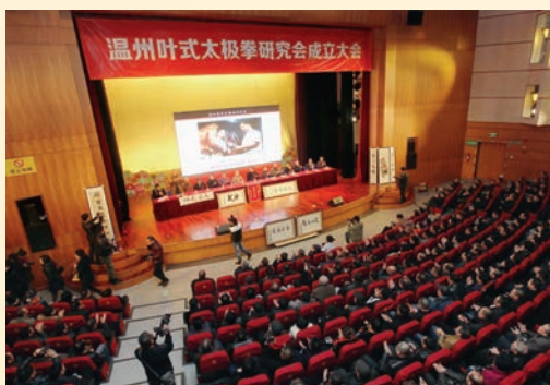
12月18日,温州叶式太极拳研究会成立。