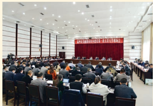
12月6日，我市美丽浙南水乡建设第一次互学现场会召开。