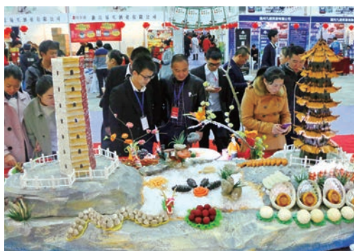
1月1日，2017温州健康时尚博览会在温州国际会展中心开幕。