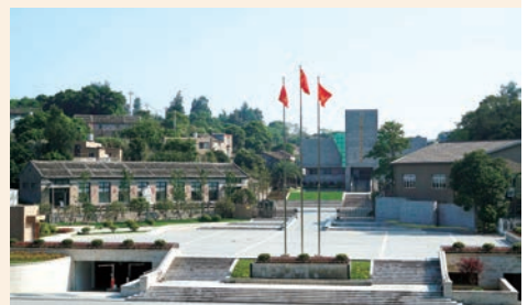
洞头先锋女子民兵连纪念馆创成国家红色旅游经典景区