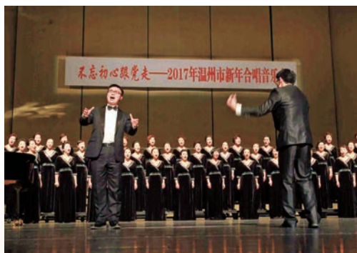
1月11日，2017年温州市新年合唱音乐会在温州大剧院上演。