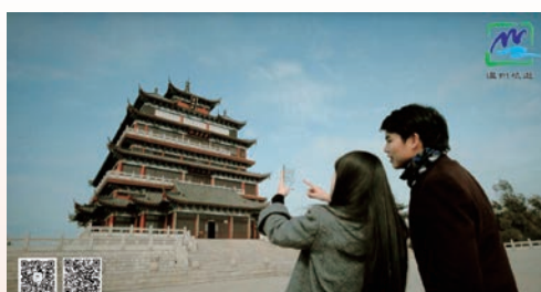
游客体验智慧旅游景区