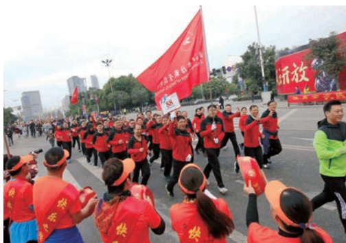
1月1日，我市元旦升国旗仪式暨“兴业银行杯”健身跑活动举行。