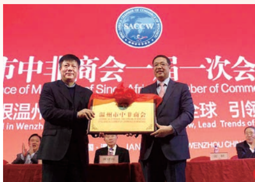
1月3日，温州市中非商会正式成立，市长张耕出席并授牌。