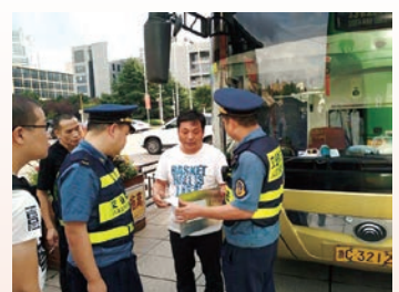
开展联合执法行动整治排查非法旅游用车