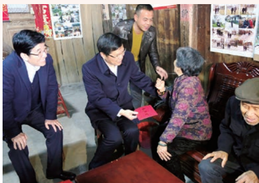
1月10日，市委书记徐立毅赴永嘉开展扶贫帮困“送温暖”活动。