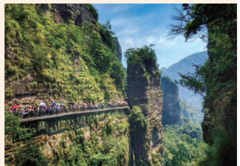
雁荡山首条玻璃栈道开放