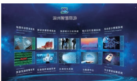
温州智慧旅游数据平台应用系统