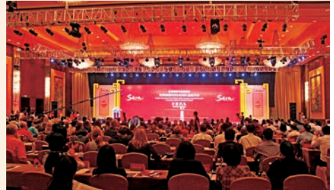
美国作家协会2016(温州)年会开幕式现场

提升品质效果喜人。 建立旅游市场综合监管机制,强势推进联合执法,重点整治户外俱乐部等非旅行社组织机构。完善旅游安全监管机制与动态督查,全年没有发生安全事故。国家旅游局发布的“十一”假日旅游“红黑榜”,江心屿荣膺“最安全旅游景区”。