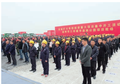
1月3日，全省扩大有效投资重大项目集中开工活动举行。图为温州市三垟城市湿地公园项目现场。