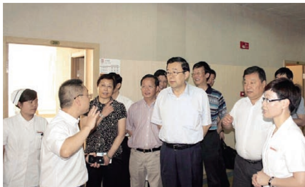
国家卫生和计划生育委员会副主任、党组副书记、国务院医改办主任孙志刚一行来我市调研社会资本办医工作

近年来，我市卫生工作坚持以深化医改引领，以实现人人享有基本医疗卫生服务为目标，以提升医疗卫生服务能力为核心，大力加快卫生基础设施建设，不断加强公共卫生体系建设，全面推动卫生事业创新发展。全市卫生资源总量大幅增加，覆盖城乡居民的公共卫生服务体系、医疗服务体系、医疗保障体系、药品供应保障体系基本建成，形成四位一体的基本医疗卫生制度。截至2014年9月，全市有公立医院47家，民办医院75家，社区卫生服务中心（站）501家，乡镇卫生院155家，村卫生室2811家。医疗机构床位达到29729张，千人床位数3.68张，同比2011年增长29.1%，增长速度远高于全省平均水平。