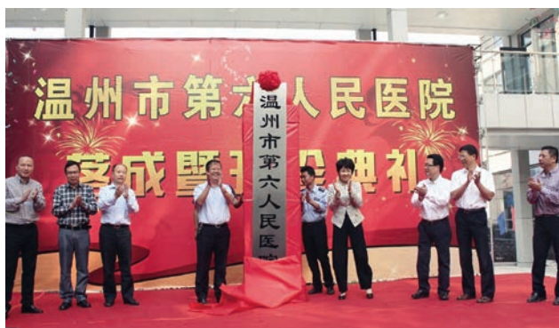
温州市第六人民医院落成开诊

近年来，我市卫生工作坚持以深化医改引领，以实现人人享有基本医疗卫生服务为目标，以提升医疗卫生服务能力为核心，大力加快卫生基础设施建设，不断加强公共卫生体系建设，全面推动卫生事业创新发展。全市卫生资源总量大幅增加，覆盖城乡居民的公共卫生服务体系、医疗服务体系、医疗保障体系、药品供应保障体系基本建成，形成四位一体的基本医疗卫生制度。截至2014年9月，全市有公立医院47家，民办医院75家，社区卫生服务中心（站）501家，乡镇卫生院155家，村卫生室2811家。医疗机构床位达到29729张，千人床位数3.68张，同比2011年增长29.1%，增长速度远高于全省平均水平。