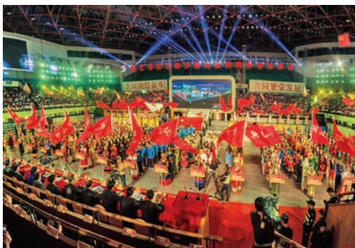
11月13日，浙江省第五届少数民族传统体育运动会在我市举行。