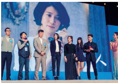
11月28日，电视剧《温州两家人》在市广电中心开机。