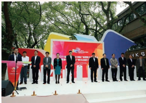
11月11日，2014温州时尚文化创意产业博览会开幕式暨温州国家广告产业试点园区开园仪式举行。