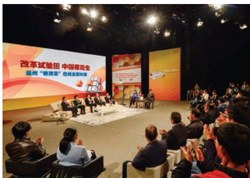
11月26日，温州“看改革”在线主题对话活动举行。