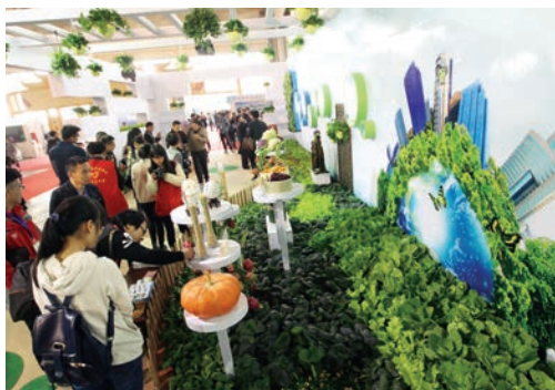
11月14日，第六届中国（温州）特色农业博览会开幕。