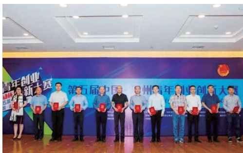
10月19日，第五届中国·温州青年创业创新大赛开赛仪式举行。