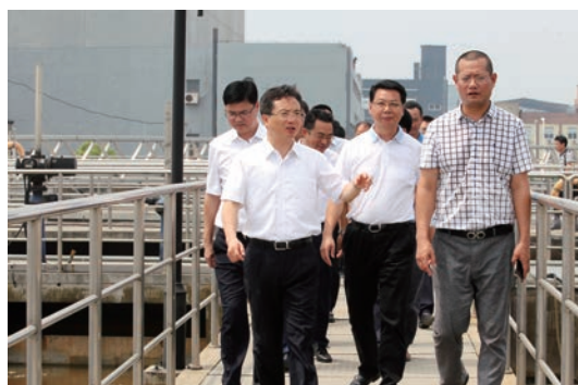
省委常委、市委书记督查温州市东片污水处理厂

环境管理：开拓“改革创新”深度。 在全省率先探索市级饮用水源地生态补偿机制改革，成立生态文明研究中心，完成环评体制市场化改革，建立生态环境报表制度，建立总量指标基本账户制度，获得环保部高度肯定。环境信息公开多次在全国120个重点城市位列第一。2017年强力推进创新“美丽温州”建设工作机制改革、最多跑一次环保审批改革与环境监测网络建设，完成中央环保督察迎检阶段性任务。