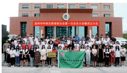
2017年7月14日，温州市环保志愿者联合会正式成立