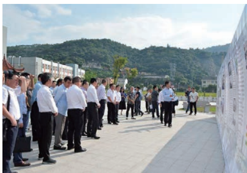
10月18日，全市剿灭劣V类水工作第五次现场会在平阳县召开。