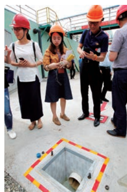
右图：牵头推进入河排污口整治，助力剿灭劣V类水体