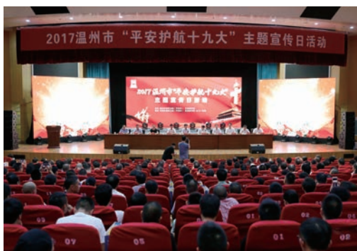
10月10日，温州市第三个“平安宣传日”主题活动在龙湾区举行。