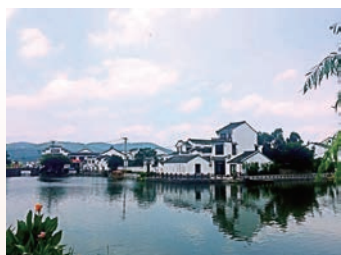
全市十大生态创建示范项目之一——平阳厚垟村