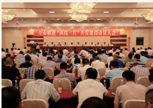
10月12日，全市推进“两线三片”开发建设动员大会召开。