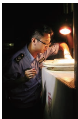
左图：开展百日环境执法夜间突击行动