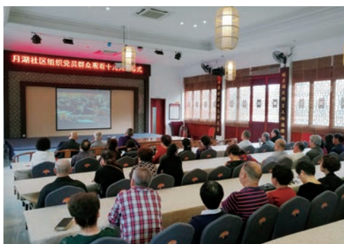
10月18日，鹿城区广化街道月湖社区党员和群众收看党的十九大开幕式。