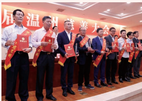
10月31日，第三届温州慈善大会举行。