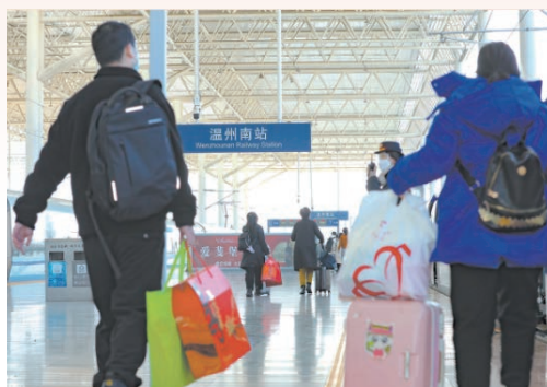
1月7日，我市启动交通运输执法护航春运“春雷”行动