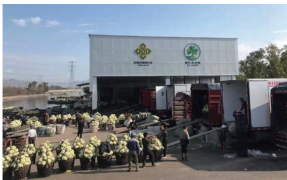
滨海花椰菜原产地交易市场开展大宗花椰菜交易