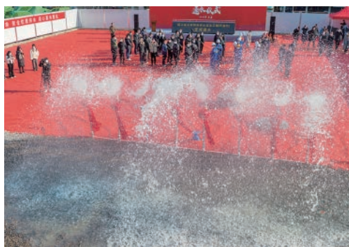
1月16日，甌江南北联网保供水应急工程（乐清段）举行通水仪式，该工程将日供乐清10万吨清水