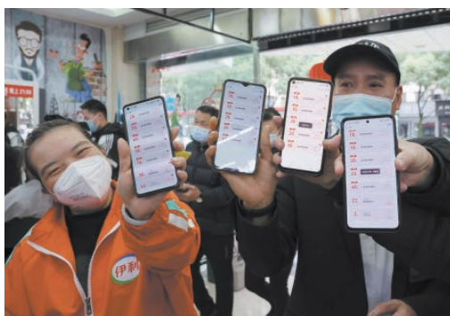
1月15日，市民展示抢到的第一期迎春消费券