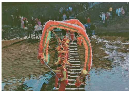
春节期间，因春晚节目《碇步桥》火出圈的泰顺仕阳碇步桥喜迎八方来客，游客同比增长132%