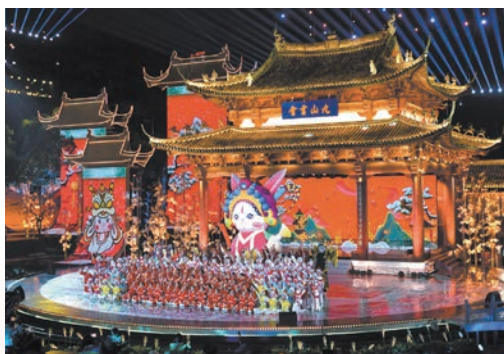
在温录制的2023年春节戏曲晚会于大年初一在央视综合频道（CCTV-1）、戏曲频道（CCTV-11）晚八点档并机播出