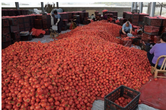
梅屿蔬菜专业合作社收购、包装番茄

打通15个部门、建设集成28项服务的“三位一体”智农共富平台，打造“种田”“销售”“贷款”“补贴”四大无忧场景，2021年9月上线“浙里办”平台以来，注册用户达1.2万余人、农资交易6972.97万元。迭代集成式生产服务。建设全国首家“三位一体+MAP”中心，提供选种配肥、数据分析等“7+3”全周期服务，滨海都市农业产业园建设“空地一体”农业数字化系统，曹村镇打造省首个数字农业示范区。迭代一链式金融服务。构建“村社授信全覆盖、融资保险全链条、专员服务全过程”金融服务，创新农户纯信用生产贷、农产品代销还款“无本种田”模式，农商行授信217亿元、惠及七成以上农户，“三有三无”农户小额贷款利率低至3.85%。迭代广渠道供销服务。建立原产地智能收购竞价平台，培育好派多、易达购等十大涉农电商、82个省级电商村和千万点赞的“小英夫妇”等农民网红直播带货，农产品网络销售额超14亿元，发展农村电商工作获国务院督查激励。