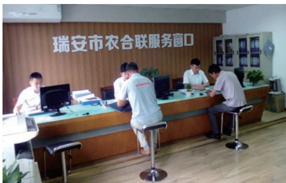
瑞安市农合联服务窗口开展便民服务