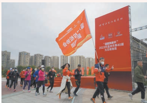
1月1日，2023年我市“温度新闻杯”元旦健身跑活动在三垟湿地公园开跑