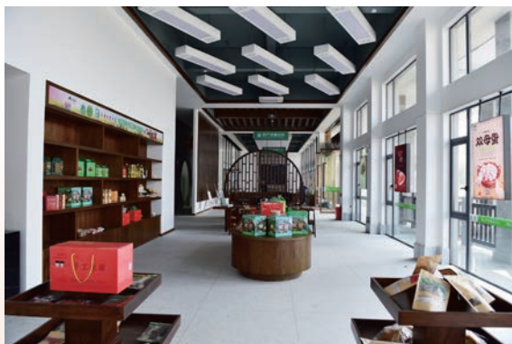
陶山为农服务中心展示展销平台销售当地优质农产品