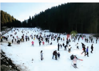
文成月老山人工滑雪场