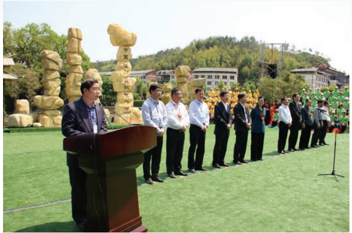
2014中国（温州）森林旅游节开幕仪式

树木多了、绿意浓了，公园多了、景观美了…这是近些年温州市民对城市环境的直观感受。目前，全市已创成省、市级森林城镇42个，省、市级森林村庄（含绿化示范村）1460个，在中心城区建成杨府山公园、白鹿洲公园、三垟湿地公园等48个城市公园和数百个滨水公园、小游园、附属绿地，市区建成区绿化覆盖率从2010年的21.86%增加到目前的41.22%，人均公园绿地面积从6.05平方米增加到12.15平方米，绿化成了百姓的“生态福利”，“创森”成为温州的美丽风景。