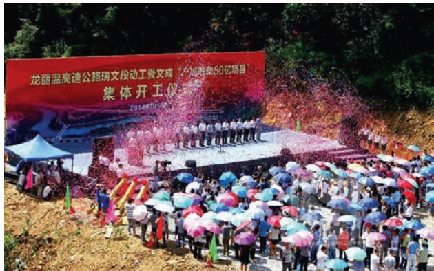
7月18日，龙丽温高速公路瑞文段动工暨文成“产城联动50亿项目”集体开工仪式举行

7月18日，龙丽温高速瑞文段动工暨文成“产城联动50亿项目”集体开工仪式在文成县岙口镇东方村举行，文成人民期盼已久的龙丽温高速公路正式破土动工，当地数千民众共同见证了这一历史性时刻。