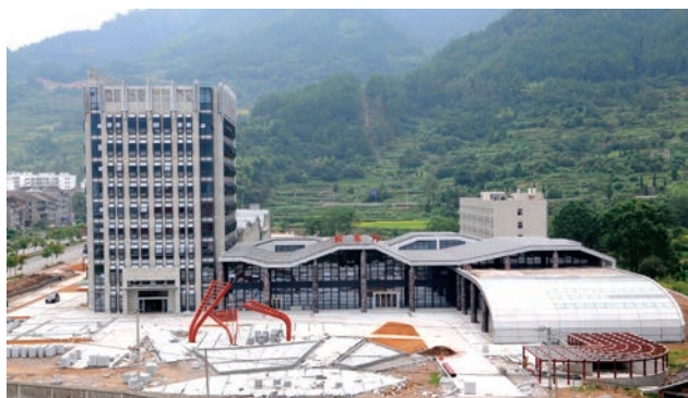
建设中的百丈漈景区旅游服务中心

另外，“产城联动50亿项目”共12个项目当天集中开工，涉及基础设施、旅游配套、产业发展、住房保障、五水共治、“三改一拆”等六大类，总投资约74.75亿元，将为文成县“绿色发展、生态富民、后发崛起”提供强有力的支撑。