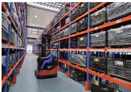
我市各地统筹疫情防控和经济社会发展，开足马力抓生产，进一步加大助企纾困力度，图为工人在生产线上忙碌