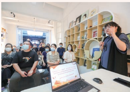
6月，全市各街道社区采用微党课、微宣讲等形式，让省第十五次党代会精神传达接地气、冒热气、入人心