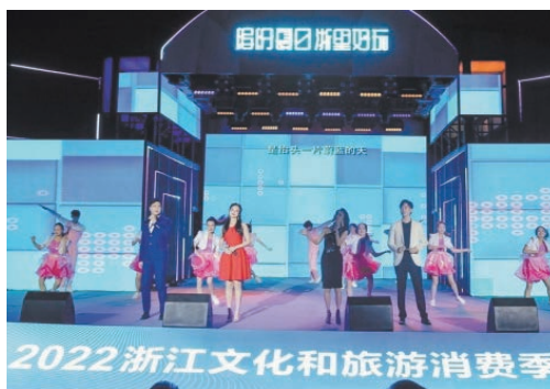
6月25日，浙江省文化和旅游厅在温州瓯江路光影码头正式启动2022浙江文旅消费季