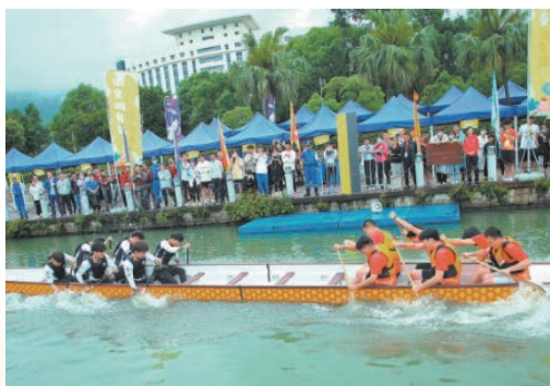
6月12日，“青春迎亚运·一起向未来”2022年温州第九届龙舟系列赛激情开划