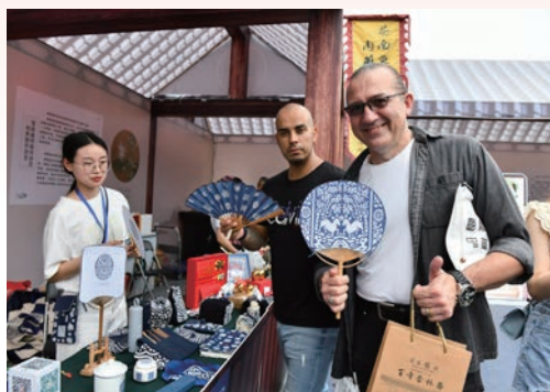
6月3日，“宋韵非遗·千年瓯风”2022年温州市“文化和自然遗产日”活动在温举行，当天的集市除了众多的市民参观外，还迎来了一些在温州工作、经商的外国朋友参观