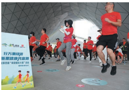
6月25日，“行万里绿道 走浙里健康共富路”——浙江省第四届“绿道健走大赛”（温州站）启动仪式在鹿城区城市阳台举行