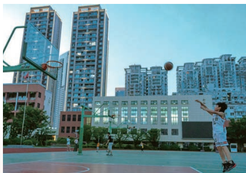
7月起，学校体育设施免费向社会开放，市民持卡入校锻炼