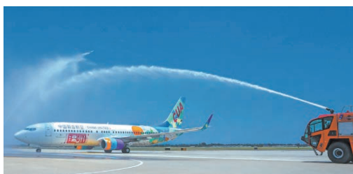
7月12日，由北京大兴机场飞来的“温州号”彩绘飞机降落温州龙湾国际机场，意味着“温州号”成功实现首飞，庆祝温州机场通航33周年