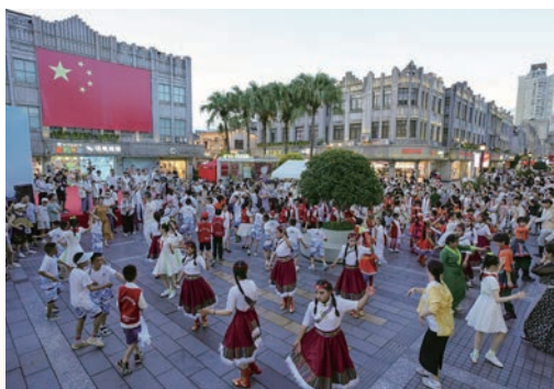
7月15日，“浙里石榴红·同心享亚运——格尔木民族少年温州行”主题活动，开启首站之旅——温格两地少年在市区五马街中心广场一起跳“锅庄舞”