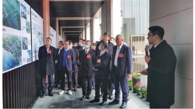
2023年市“两会”期间,瓯江新城规划正式亮相,市自然资源和规划局主要负责人向市人大代表、政协委员介绍讲解规划情况

四、当好改革创新探路者,打造便民惠企样板。 率全国之先上线“地灾预警码”,实现个性化靶向预警。创新“多合一”改革,“拿地即开工”改革被评为全省自然资源系统改革创新优秀案例和温州市改革突破奖金奖。我市不动产登记队伍作风建设工作经验获自然资源部《不动产统一登记专栏》刊发推广,登记财产营商环境评价结果位居全省一档第一名。