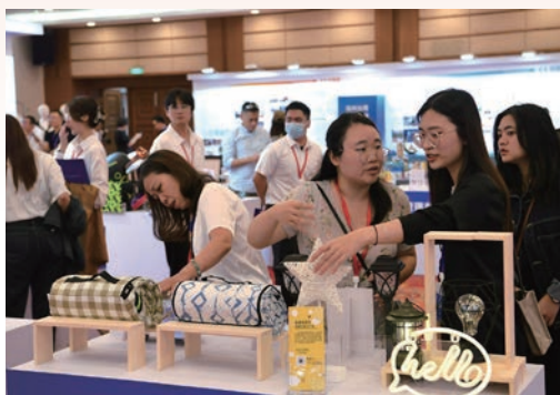
7月7日，2023浙江·台湾合作周温州分会场活动开幕，通过产业合作，人才招引、创新创业等多维度融合发展的成果呈现，积极唱响两岸融合发展的温州好声音