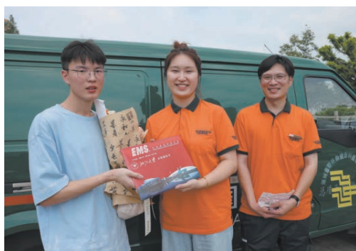
7月13日，我市第一批高考录取通知书投递