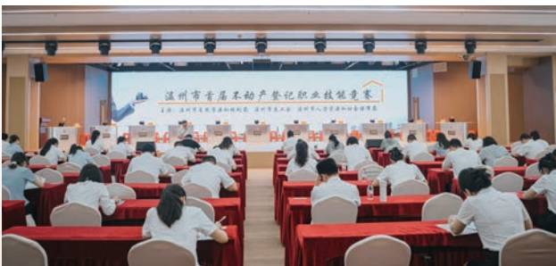
成功举办温州市首届不动产登记职业技能竞赛

六、当好“两山”理念践行者,夯实绿色发展根基。 累计入选全省林业增汇试点2个,数量全省第一。南麂列岛被列入国际重要湿地名录,为我省第二个世界级湿地。入选全国自然教育基地1个。创成全国首届“和美海岛”2个,数量全省第一。获评2023年全国海洋生态保护修复典型案例1个,实现全省首单红树林蓝碳交易。