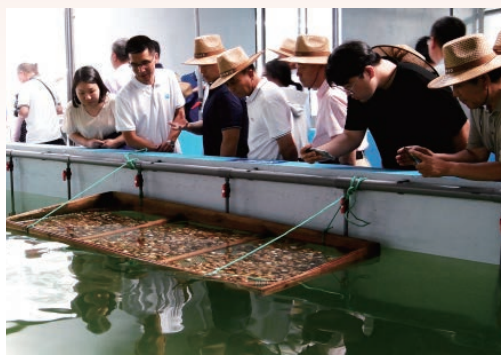
7月11日-7月12日，全国水产绿色健康养殖技术推广“五大行动”现场会在我市举行