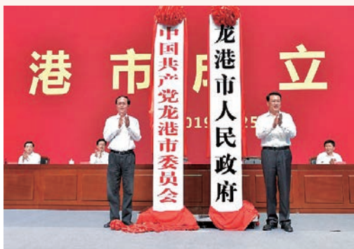
9月25日，龙港市成立大会举行。省委书记车俊，省委副书记、省长袁家军为“中国共产党龙港市委员会”“龙港市人民政府”揭牌