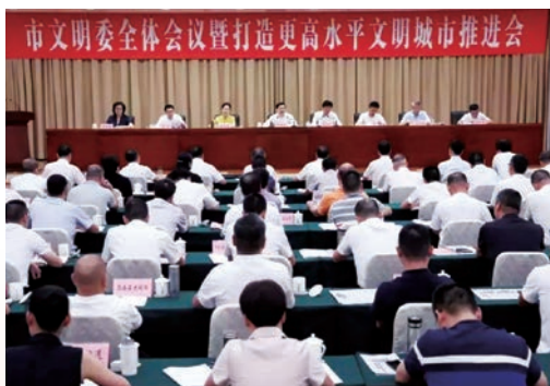
9月18日，市文明委全体会议暨打造更高水平文明城市推进会召开