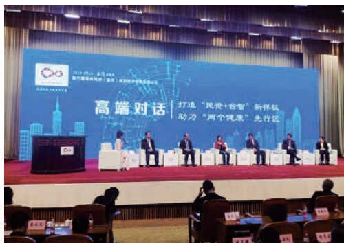
9月19日，第六届海峡两岸（温州）民营经济创新发展论坛举行