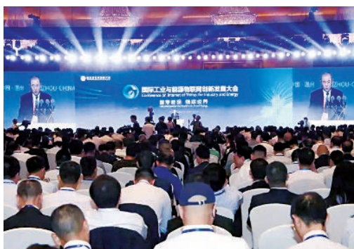
9月10日，国际工业与能源物联网创新发展大会在我市开幕