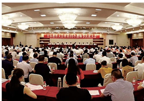
9月10日，全市教育大会暨第35个教师节庆祝大会隆重举行