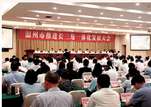
9月5日，我市召开推进长三角一体化发展大会