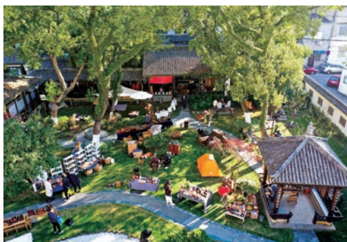
12月31日，鹿城区“墨池雅集”春市活动在墨池公园举行，现场展示了文玩茶具、竹木银器、瓯窑瓯绣、书画手作等等，还开展了书法家送福送春联活动