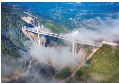
12月22日，溧宁高速公路文成至泰顺段高速正式通车，我市全面实现“县县通高速”