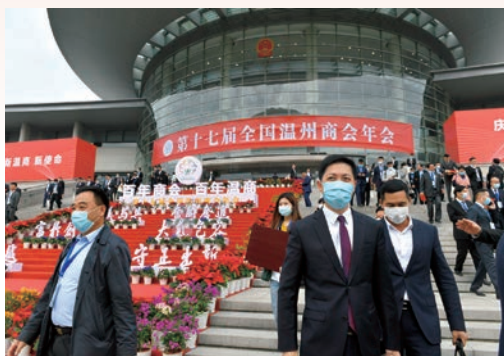
12月1日，第十七届全国温州商会年会在市人民大会堂举行