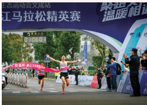
12月13日，2020年浙江省首届生态运动会在文成县举行，共设马拉松、山地自行车、越野汽车丛林穿越、风筝、冰雪运动、小龙舟等6个竞赛项目