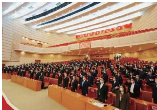
12月30日，我市241名新任公务员面对国徽庄严地向宪法宣誓