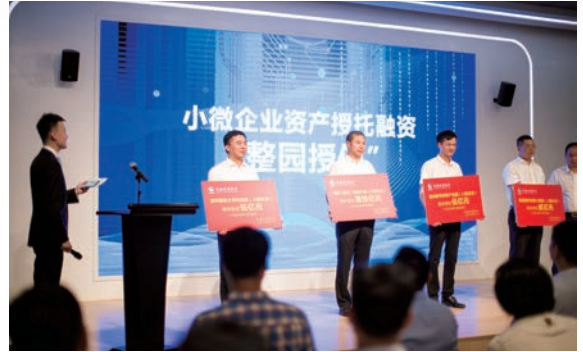
2020年7月1日，瓯海区“普惠金融服务站”揭牌仪式

在综合运用“线下”实地走访摸排的基础上，充分发挥数字手段，通过“信用分”以及风控模型，严控贷款准入。同时，在放贷环节，通过积极发挥普惠金融服务站及协贷员桥梁作用，定期对已放贷企业开展回访，并动态关注企业“信用分”变化情况，有效强化小微企业贷款过程管理。对贷款违约企业由政府、园区、银行与企业进行协同调解，引导企业协商处置受托资产，强化“软约束”。同时，加强部门联动，对于协商无法处理解决的风险，采取多部门联合惩戒、公开曝光、重点监管等举措，对恶意逃废债企业增强威慑力，筑牢风控网络。